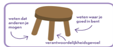
Zelfvertrouwen: een kruk met drie poten

Vanaf maandag 26 februari a.s. starten we met thema 4 van Leefstijl: Ik vertrouw op mij. Dit thema gaat over zelfvertrouwen. Kinderen ontwikkelen zelfvertrouwen als ze een realistisch zelfbeeld hebben. Dus als ze weten wat ze kunnen en willen, maar tegelijkertijd ook beseffen wat ze (nog) niet kunnen. Daarnaast durven kinderen meer op zichzelf te vertrouwen als ze geleerd hebben verantwoordelijkheid te nemen. Kinderen vinden het fijn om te laten zien dat ze het zélf kunnen. Ten slotte zijn liefde, aandacht en waardering van mensen uit de directe omgeving onontbeerlijk voor de ontwikkeling van een gezond gevoel van eigenwaarde.